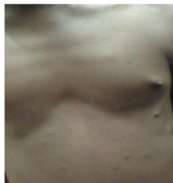
Figure 3 : neurofibromes dermiques et taches café au lait

Les atteintes cutanées étaient de type de tache café au lait (TCL), de forme arrondie ou ovale mesurant 1mm à 5 cm de diamètre, chez tous les patients (figure 3).