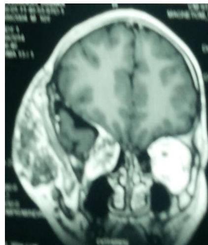
Figure 5 : Tomodensitométrie :

La tomodensitométrie (TDM) objectivait une atteinte osseuse chez tous les patients. Cet envahissement intracrânien se faisait au travers de la fissure orbitaire avec une ostéolyse de l'os sphénoïdal (figure 5), et une atteinte du labyrinthe ethmoïdal et du sinus maxillaire chez deux patients ; une ostéolyse de la paroi orbitaire adjacente et du sinus caverneux, une dysmorphie de l'arcade zygomatique, chez les autres.