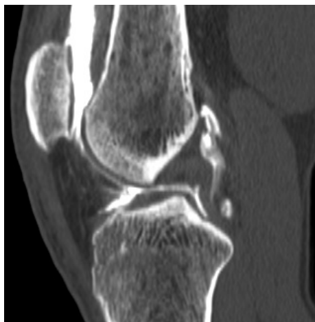
Fig.5 : Arthroscanner, reconstruction sagittale= Rupture partielle du LCP. Amincissement du segment distal, avec épaissement du segment proximal du ligament