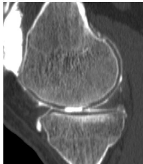
Fig.6 : Arthroscanner, reconstruction sagittale Erosion du cartilage condylien (flèche).