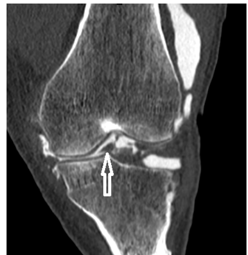
Fig.4 : Arthroscanner, reconstruction coronale= Fissuration avec luxation d'un fragment méniscal (flèche) dans l'échancrure inter condylienne (anse de seuil luxée)